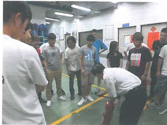
滅火器位置與使用